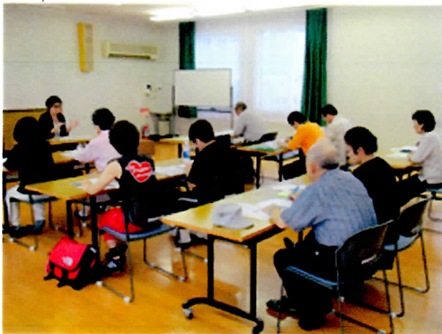
“脳を元気に”講座『楠病院のお話し』